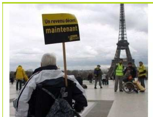
Manifestation à Paris, à l'appel du mouvement "Ni pauvre ni soumis" (NPNS) pour réclamer un revenu d'existence décent, le 27 mars 2010

"Le gouvernement a examiné attentivement la proposition d'instaurer un revenu minimum individuel d'existence en lieu et place de l'Allocation adulte handicapé (AAH)", a déclaré à l'Assemblée nationale la secrétaire d'Etat à la Famille et à la Solidarité, Nadine Morano.